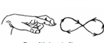
Emmêlé dans le fil