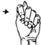
Je suis coincé