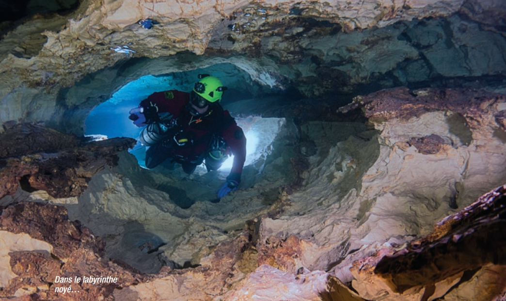
Dans le labyrinthe noyé...

Je reviens vers le lac de mes précédents rêves. Je suis intrigué par l'arrêt brutal de la galerie sur ce mur stalagmitique... Je ne tarde pas à me faufiler au travers de la calcite et derrière cette muraille j'entrevois la suite. Un autre superbe bassin débute la continuation de la galerie. Je vais encore parcourir plusieurs centaines de mètres dans cette galerie déchiquetée. À mes pieds je découvre des puits vertigineux. Des lancers de pierre indiquent des profondeurs importantes. Je note aussi la présence de galeries remontantes et descendantes. On reviendra mais l'heure tourne, la fatigue se fait sentir, il faut sortir. Nous retrouvons les équipements de plongée, Bruno renfile sa combinaison étanche, je le suis avec mon gros sac.