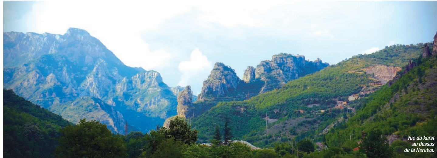
Vue du karst au dessus de la Neretva.