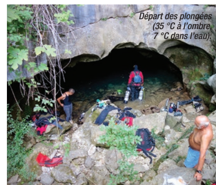
Départ des plongées (35 °C à l'ombre, 7 °C dans l'eau)

Il revient m'informer. Je m'équipe : combinaison humide et deux scaphandres de 7 litres dûment gonflés. Avec aisance je parcours la centaine de mètres dans une eau translucide à perte de faisceau d'éclairage. Mes lampes révèlent la beauté intérieure de la montagne. Je suis en lévitation dans cette eau limpide. J'évolue avec un gros sac rempli de matériel de spéléologie, de topographie, des couvertures de survie, de quoi manger dans un bidon étanche... et il fait froid. Je ne m'attarde pas, je palme, je me tracte sur les aspérités rocheuses... Je découvre