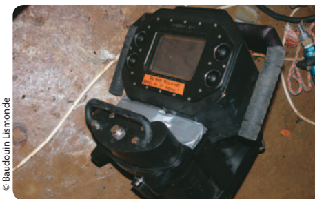
Le Cobra Tac : une console utilisée pour la cartographie.

Ce Cobra Tac de la Sté Teledyne est proche du fonctionnement de l'ACDP à ultrasons. Cet appareil, sans être une centrale à inertie, est capable de mesurer sa vitesse de déplacement, de relever en permanence sa profondeur et sa direction au moyen d'un