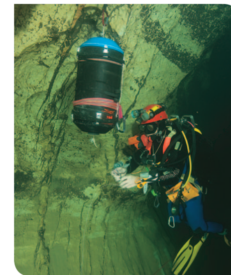
Une balise pour retrouver le point en surface.

compas. De plus, il prend en compte son positionnement par rapport à l'horizon et mesure la hauteur entre lui et le bas de la galerie. Il se présente comme une grosse console de jeux avec deux poignées et quelques boutons de réglage. Nous l'avons testé dans Port-Miou, lors de cette tentative nous avons fermé une boucle de 300 m avec une erreur inférieure à 3 m loin de notre imprécision en topographie classique. Les résurgences de Port-Miou et du Bestouan constituent un laboratoire naturel d'études des sources sous-marines. En dehors de l'utilisation possible par l'homme de cette ressource insoupçonnée, elles présentent des intérêts scientifiques considérables où tellement de choses restent à faire. ■