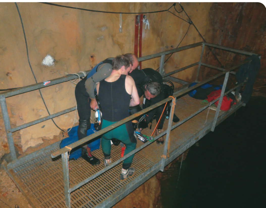
Les plongeurs souterrains mesurent tout sauf leurs efforts!

L'opération consiste à déposer une bobine électromagnétique dans des points remarquables de la rivière et à localiser la verticale de ces points en surface avec un récepteur. Au Bestouan nous avons localisé en surface 3 points du tracé de la rivière (700, 1300 et 1600 m) depuis l'émergence en mer. Pour cela nous avons contribué au développement et à la mise au point d'une balise émettrice capable de fonctionner avec les contraintes dues à l'eau saumâtre et à la couche de calcaire au-dessus de la rivière (250 à 300 m).