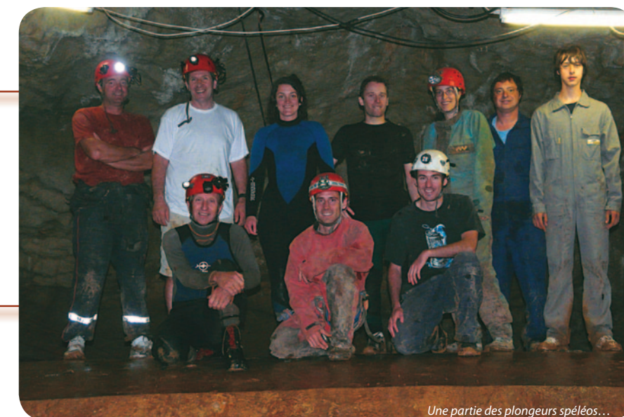
Une partie des plongeurs spéléos...