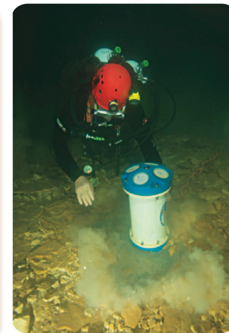
Il a fallu mesurer le déplacement des sédiments.

la puisant à la surface de la mer. Par contre les explorations n'ont commencé qu'après la Deuxième Guerre mondiale. Un conduit de grande taille (plus de 20 m de section) se développe sur plus de 2,3 km vers le nord à des profondeurs variant entre 10 et 40 m sous le niveau de la mer. À cet endroit, le conduit s'enfonce à la verticale et les explorations des plongeurs s'arrêtent à ce jour à la côte -178 m (Xavier Meniscus 2008) sans avoir atteint le fond de ce grand puits. Ces deux branches cassidaines sont les exutoires actifs d'un réseau de galeries noyées, les plus grandes d'Europe, qui témoignent de l'existence d'un karst profond développé au cours des périodes géologiques où le niveau de la mer était à quelque 1 000 m sous son niveau actuel.