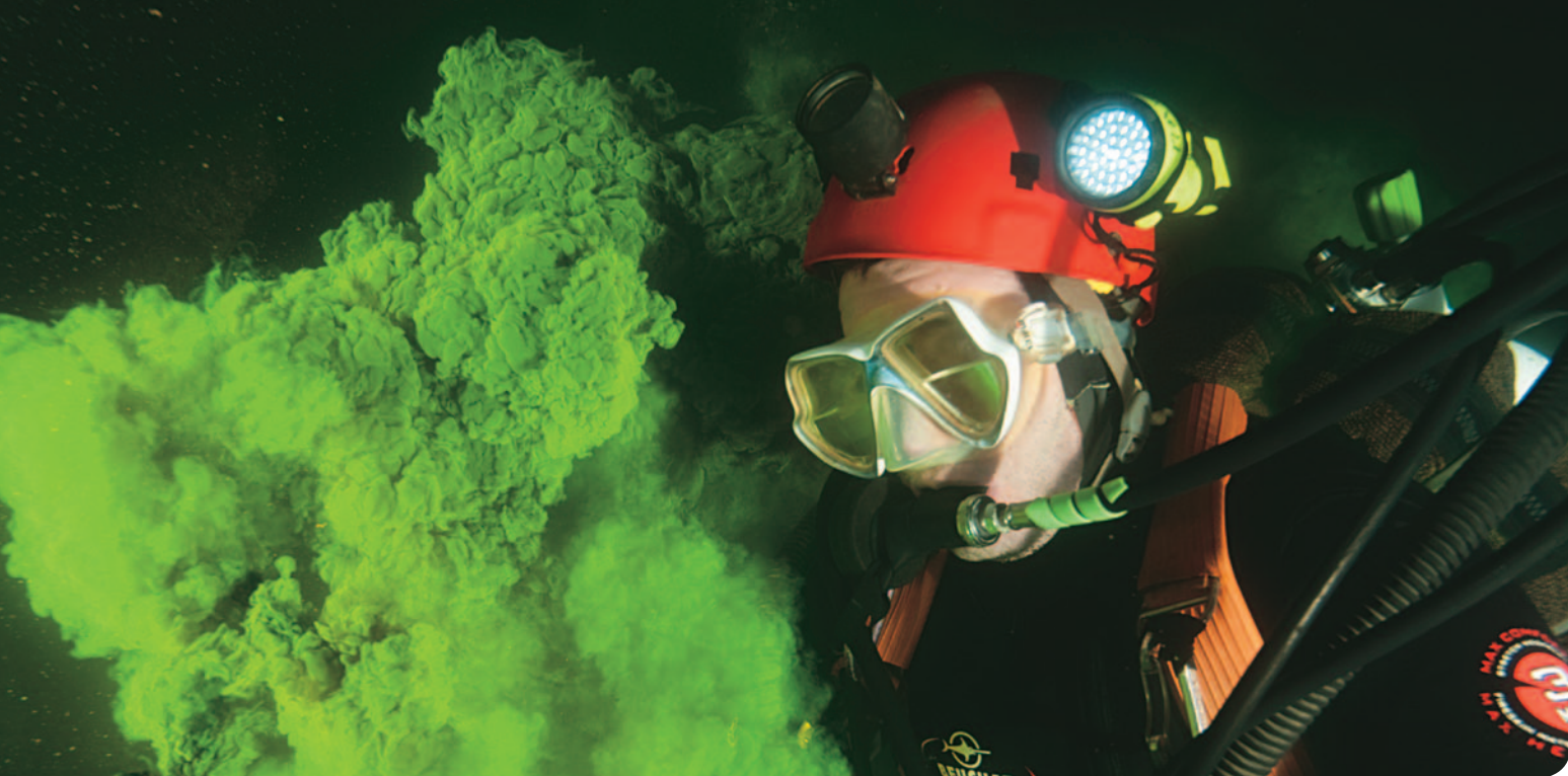
Le colorant : une méthode simple, pratique et amusante de mesurer le débit.