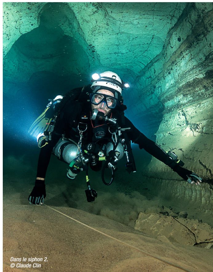
Dans le siphon 2.

L'eau qui jaillit d'une source provient rarement des profondeurs mystérieuses de la Terre et encore moins en milieu calcaire. Les eaux de pluie sont captées par les réseaux souterrains karstiques sur une surface très importante. Cette surface représente le bassin d'alimentation de la source de Glane. Sur cette surface sont présents des terrains agricoles, des routes, un chemin de fer, des villages et habitations, des fermes agricoles. Ces activités peuvent avoir des incidences sur la qualité des eaux et leurs pollutions. Développer les connaissances particulières de l'ensemble de ce bassin karstique est un préalable essentiel à la réflexion pour mettre en place des moyens de préservation. C'est à la suite d'alertes sur la qualité de l'eau ou des débits ponctuellement insuffisants que le Syndicat mixte des eaux de Dordogne (SMDE24) a contacté les spéléologues locaux, en l'occurrence le président du CDS24 Patrick Rousseau, qui s'est tourné vers les plongeurs de la région. Les représentations régionales et départementales de la FFESSM (CSNA) et de la FFS (CSRNA) ont signé une convention avec le SMDE24. Elle définit les cadres de partenariat avec tous les acteurs professionnels, politiques, publics et bénévoles impliqués dans ces démarches de préservation durable.